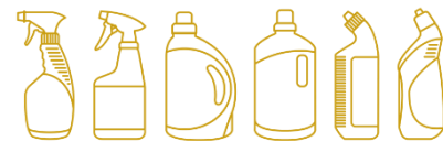
Bảng 1. Nồng độ khuyến nghị để khử trùng các bề mặt KHÔNG TIẾP XÚC VỚI THỰC PHẨM để phòng ngừa COVID-19.

chuyên gia y tế và người dân để xác định các sản phẩm phù hợp để sử dụng trong đợt bùng phát COVID-19. Để truy cập danh sách đầy đủ của các chất khử trùng được phê chuẩn, hãy truy cập trang web của Hội đồng Hóa học Hoa Kỳ ( Americanchemistry.com ).