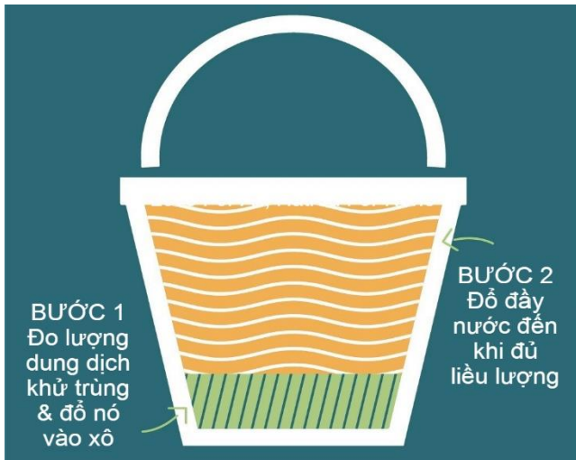
Hình 2. Cách chuẩn bị dung dịch khử trùng.

Liều lượng pha chế khuyến nghị dựa trên nồng độ phổ biến nhất có thể sử dụng. Hãy tính toán dựa trên nồng độ chất khử trùng của bạn. Luôn phải tuân theo khuyến nghị của nhà sản xuất về nồng độ chất khử trùng và thời gian tiếp xúc trên nhãn chai. Sử dụng chất khử trùng với nồng độ đậm đặc hơn không có nghĩa là có thể loại bỏ mầm bệnh hiệu quả hơn.